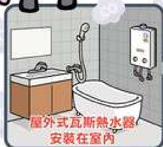
屋外式瓦斯熱水器 安裝在室內