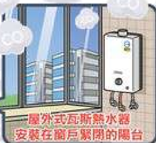
屋外式瓦斯熱水器 安裝在窗戶緊閉的陽台