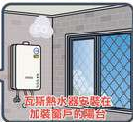
瓦斯熱水器安裝在 加裝窗戶的陽台