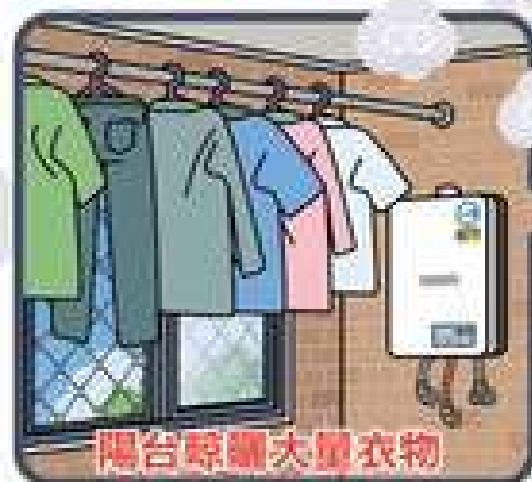
陽台晾曬大量衣物