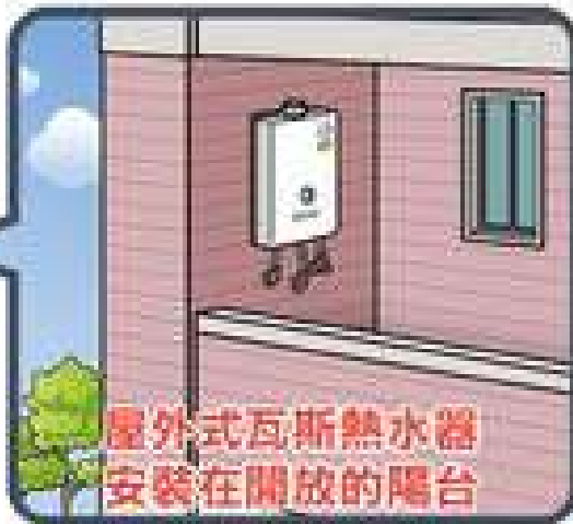
屋外式瓦斯熱水器 安裝在開放的陽台