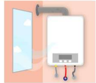
半密閉強制排氣式(FE式)