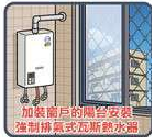
加裝窗戶的陽台安裝 強制排氣式瓦斯熱水器