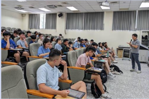
產業研究成果發表會