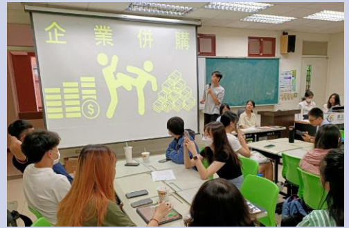
小組製作產業研究報告